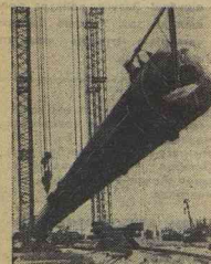
НА СНИМКАХ: Будапешт. Сердце парламента: монтаж оборудования на одном из участков газопровода «Брат- ство».

Народная Венгрия отгра- дничала 32-ю годовщину освобождения от фашизма. Венгерский народ строит социалистическое общество. Дружба с Советским Союзом и другими братскими стра- нами — основа успехов ВНР. Например, Венгрия не имеет морских границ, а торговый флот республики заходит в порты тридцати стран мира. Порты социа- листических стран всегда открыты для венгерских ко- раблей. Хорошо помогают народному хозяйству ресто- рки и нефтепровод «Друж- ба», и газопровод «Брат- ство», и высоковольтная электростанция «Мир», по- строенная с помощью СССР. Генеральный секретарь ЦК КПСС Л. И. Бреж- нев, Председатель Прези- денту Верховного Совета СССР Н. В. Подгорный и Председатель Совета Мини- стров СССР А. Н. Косыгин от имени советского народа сердечно поздравили венге- рский народ с национальным приходом.